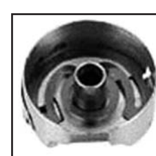
BC-PF9076-NBL PFAFF/DURKOPP TYPE

Для: ADLER.BROTHER.CONSEW. HUSQVARNA.JANOME.JUKI. MITSUBISHI.NECCHI.RICCAR. TOYOTA.YAKUMO.YASIMA SINGER 95.96.103.188U.195K.196K.245