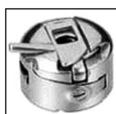
BC-31-15 тип "CB"

Для: SINGER 31CL.(кроме 31-19, -20). 44-10,331k CONSEW 30