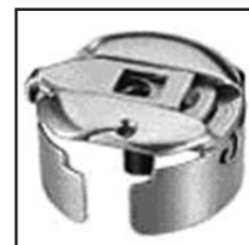
BC-DBM(Z1) Увеличенный размер

Для: CONEW 175.176. TOYOTA D530.-18E.-30P. -101.-110.-120. SEIKO LZH-EVL.-EVLC