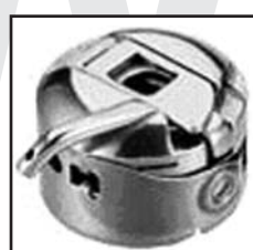
BC-LK(J3) тип "CB"