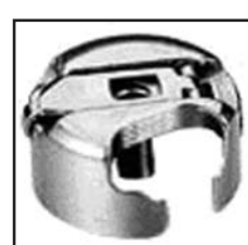
BC-DBM(2)-NBL1 Увеличенный размер

Для: SINGER 31CL.(кроме 31-19, -20). 44-10,331k CONSEW 30