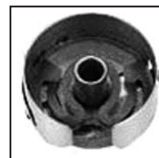
BC-PF9076(TG)-NBL6 PFAFF/DURKOPP TYPE