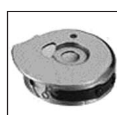
CP-M82C(1182) увеличенный размер с пружинкой

Для: JUKI LH-1162.1162-4.5 SICAMA(TASICO) SC-1162-5.6