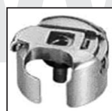
BC-DLN Стандартный размер Отверстие 10mm

Для: PFAFF . 151 GOLDEN WHEEL CS-861.862.8810.8820