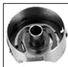
BC-PF9076(14)NBL PFAFF/DURKOPP TYPE