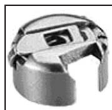
BC-PF9076 PFAFF/DURKOPP TYPE отверстие 9mm

Для: PFAFF 133.134.232.234.260.300.331. 332.333.341.343.360.432.433. 434.437.438.439.461.463.465. 467.481.483.485.487.489. ADLER . 069. CONSEW 277.