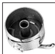
BC-LK(J)-NBL тип "CB"